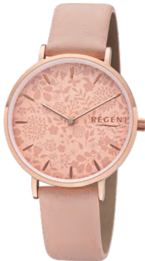
BA-503 Metall IPR, 3 Bar UVP 49,90 €