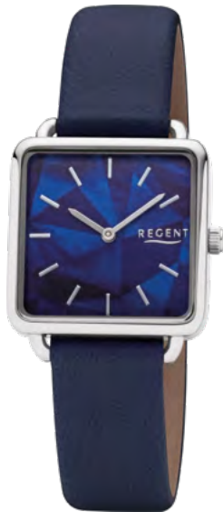
BA-507 Metall IPS, 3 Bar UVP 54,90 €