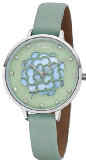
BA-493 Metall IPS, 3 Bar UVP 59,90 €