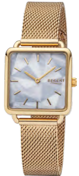
BA-509 Metall IPG, 3 Bar UVP 69,90 €