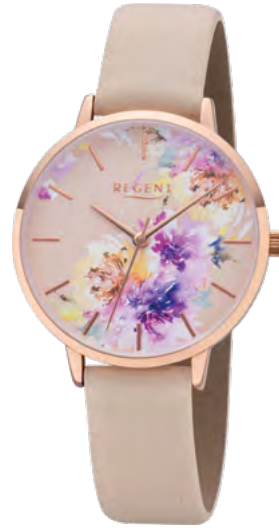
BA-497 Metall IPR, 3 Bar UVP 49,90 €