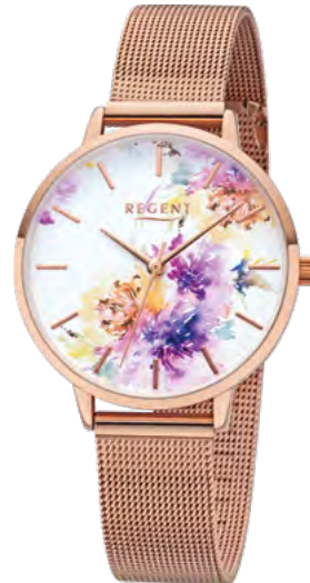
BA-500 Metall IPR, 3 Bar UVP 64,90 €