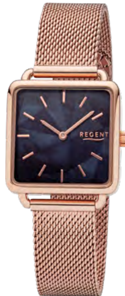
BA-510 Metall IPR, 3 Bar UVP 69,90 €