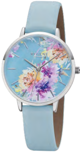
BA-495 Metall IPS, 3 Bar UVP 49,90 €