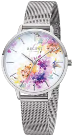
BA-498 Metall IPS, 3 Bar UVP 54,90 €