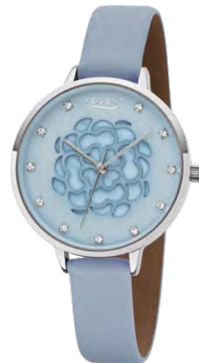
BA-492 Metall IPS, 3 Bar UVP 59,90 €