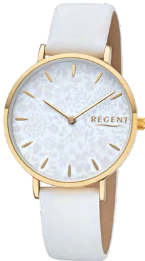
BA-502 Metall IPG, 3 Bar UVP 49,90 €