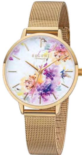
BA-499 Metall IPG, 3 Bar UVP 64,90 €