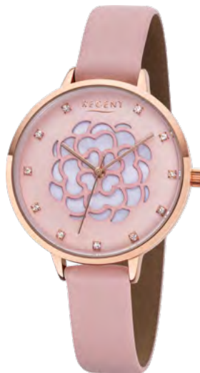
BA-491 Metall IPR, 3 Bar UVP 59,90 €