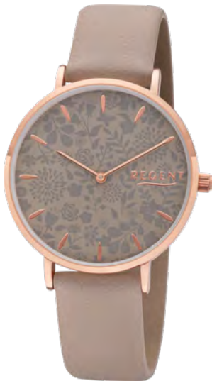
BA-504 Metall IPR, 3 Bar UVP 49,90 €