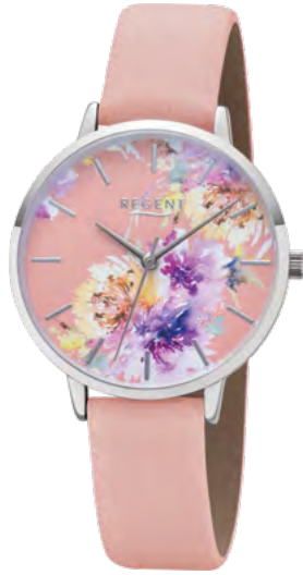
BA-496 Metall IPS, 3 Bar UVP 49,90 €