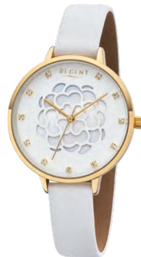
BA-494 Metall IPG, 3 Bar UVP 59,90 €