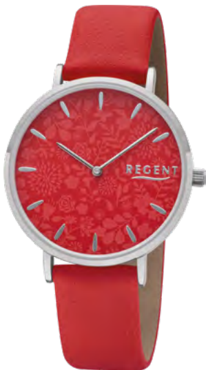
BA-501 Metall IPS, 3 Bar UVP 49,90 €