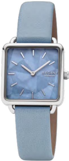
BA-506 Metall IPS, 3 Bar UVP 54,90 €