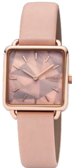
BA-508 Metall IPR, 3 Bar UVP 54,90 €