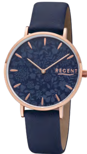
BA-505 Metall IPR, 3 Bar UVP 49,90 €